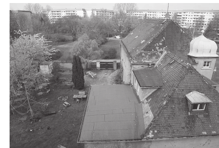
Blick vom Schönauer Kirchturm auf das alte Schulgebäude

Allen eine schöne und segensreiche Zeit.